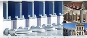
15-19 July 2018, 17th International Meeting on Chemical Sensors University of Vienna, Universitätsring 1, 1010 Vienna, Austria